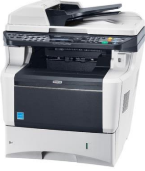
Kyocera- A4- FS-3040MFP